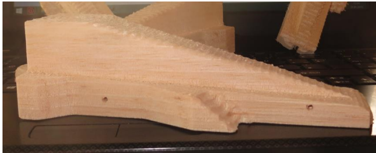
Das Chassis ist bereits fertig.